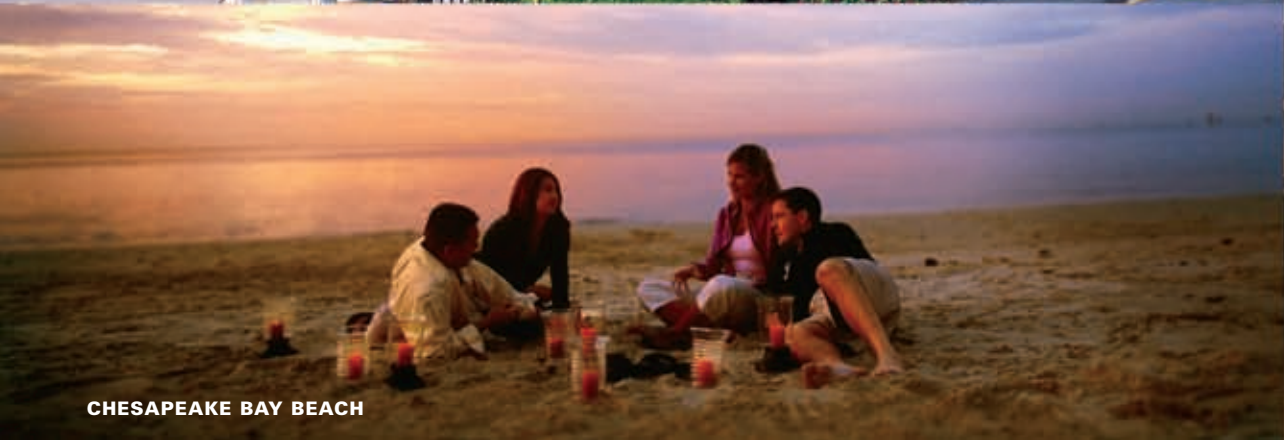
CHESAPEAKE BAY BEACH